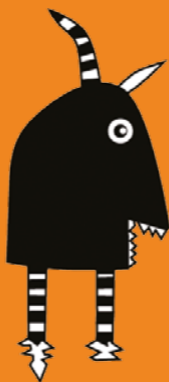
Illustration / Design graphique Anaïs Juin • Ne pas jeter sur la voie publique.