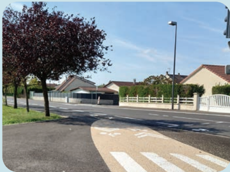
Rue de Quimper - Liverdun