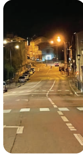
Avant installation - Frouard

Depuis juin 2022, suite à la hausse des prix de l'énergie, l'éclairage public sur tout le territoire est éteint entre minuit et 5h30. Avec un premier résultat très encourageant : une nette réduction de la pollution lumineuse et de la facture énergétique d'environ 500 000 euros en 2023, soit 40% d'économie globale.